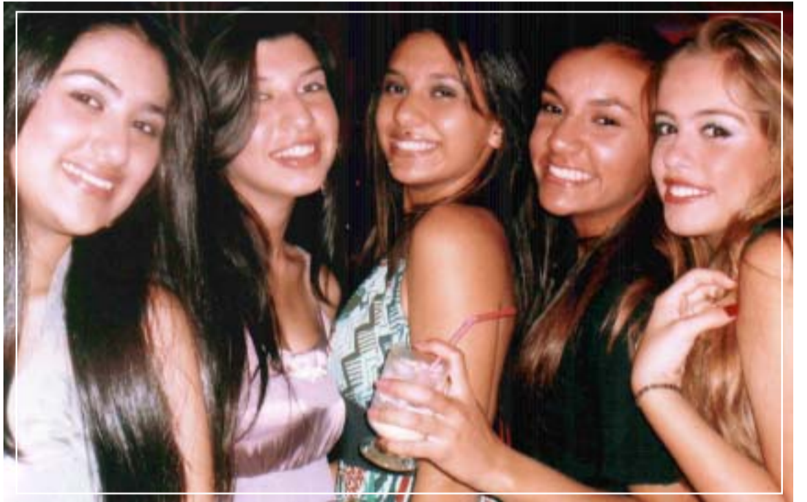
...sempre foi considerada na região como a cidade de mulheres bonitas