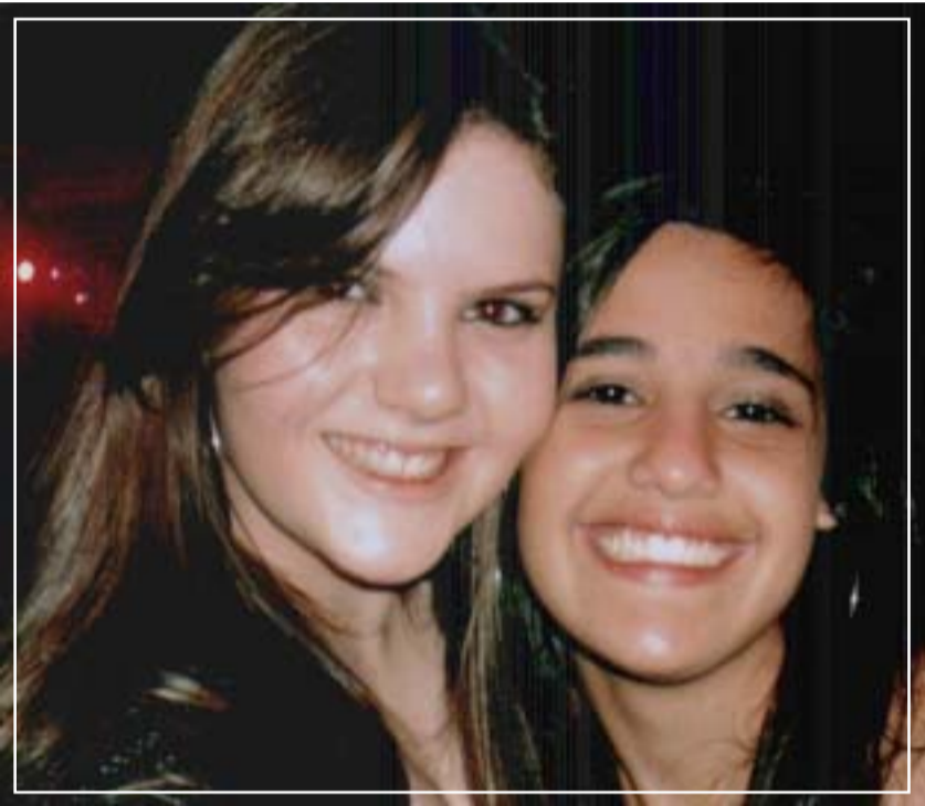
Formiga com suas mulheres belíssimas...