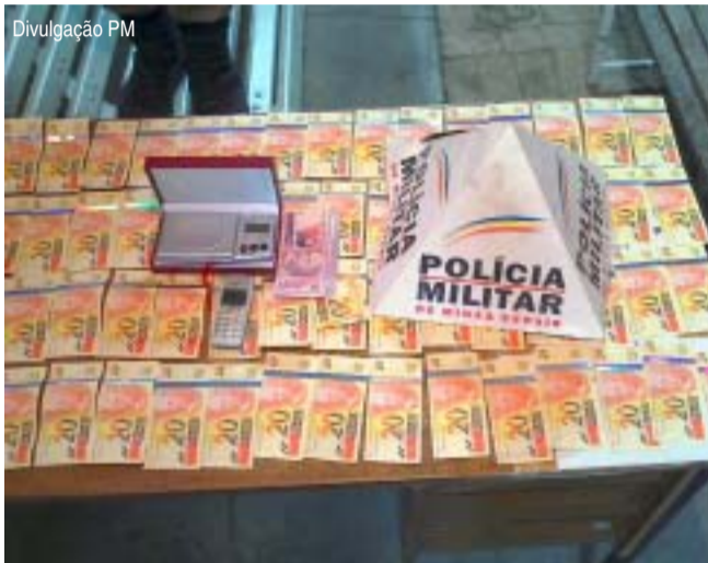
Foram apreendidas uma pedra de substância semelhante ao crack, 75 cédulas falsas no valor de R$ 20 e uma balança

De acordo com o Boletim de Ocorrência 7439/09, o suposto autor foi preso em flagrante, sendo conduzido à Delegacia de Polícia. A droga, as cédulas falsas e a balança também foram apreendidas.