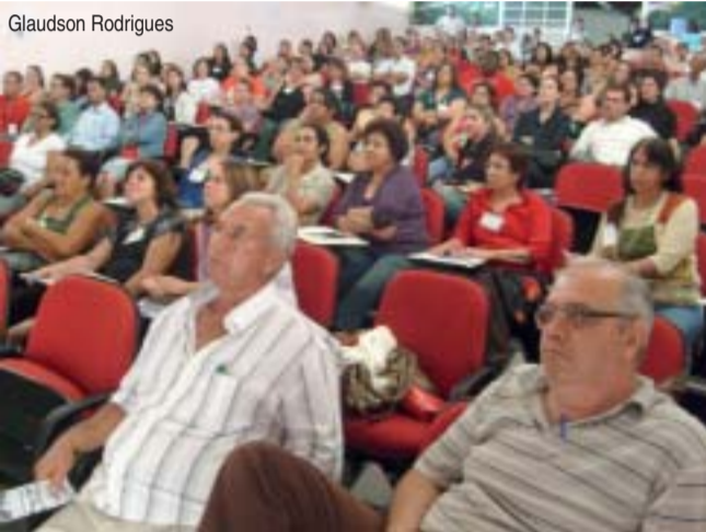
O ponto alto da conferência foi a apresentação do Plano Municipal de Segurança Alimentar e Nutricional

A II Conferência Municipal de Segurança Alimentar e Nutricional ocorreu na tarde de quarta-feira (22), no Auditório Odette Khouri. O evento foi realizado pelo Conselho Municipal de Segurança Alimentar (Comsea) e reuniu mais de cem pessoas no local.