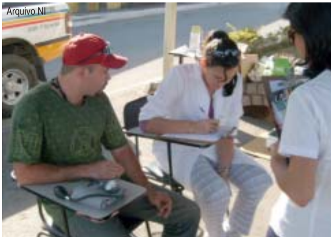
Diversas atividades serão oferecidas na sede do Sest/Senat, na MG-050

Para celebrar o dia de São Cristóvão e o Dia do Motorista em Pains, haverá neste domingo (26) uma carreta que sairá às 8h30 da Igreja do Rosário, sentido ao bairro Alvorada, onde, num local estratégico, o padre dará a bênção aos motoristas e, em seguida, será celebrada uma missa em ação de graças. No domingo passado (19) houve uma cavalgada e um almoço em comemoração a essa data.