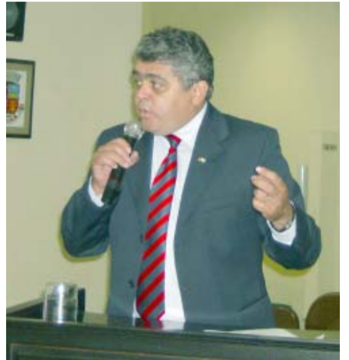
Dr. Reginaldo atesta: vem aí a CPI da Saúde