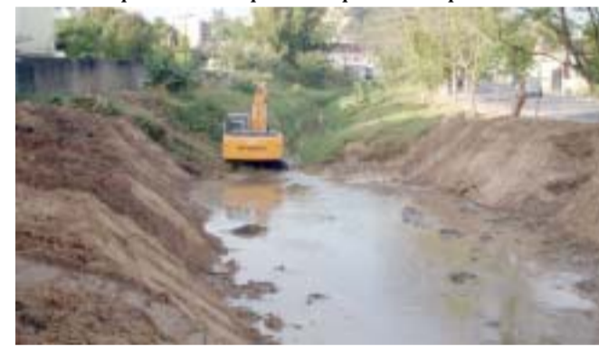
O serviço está sendo realizado para evitar surpresas no período chuvoso, que está próximo

mercado ABC, e a ponte no bairro dos Quartéis). A extensão do rio Mata Cavallo dentro do município é de 12 quilômetros.