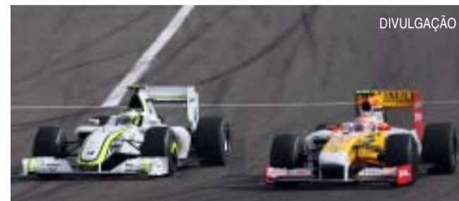
GP da Hungria pode ser decisivo para as pretensões de Rubinho e Nelsinho na temporada

Pelo lado da Red Bull, apesar do bom momento, a hora é de 'secar'