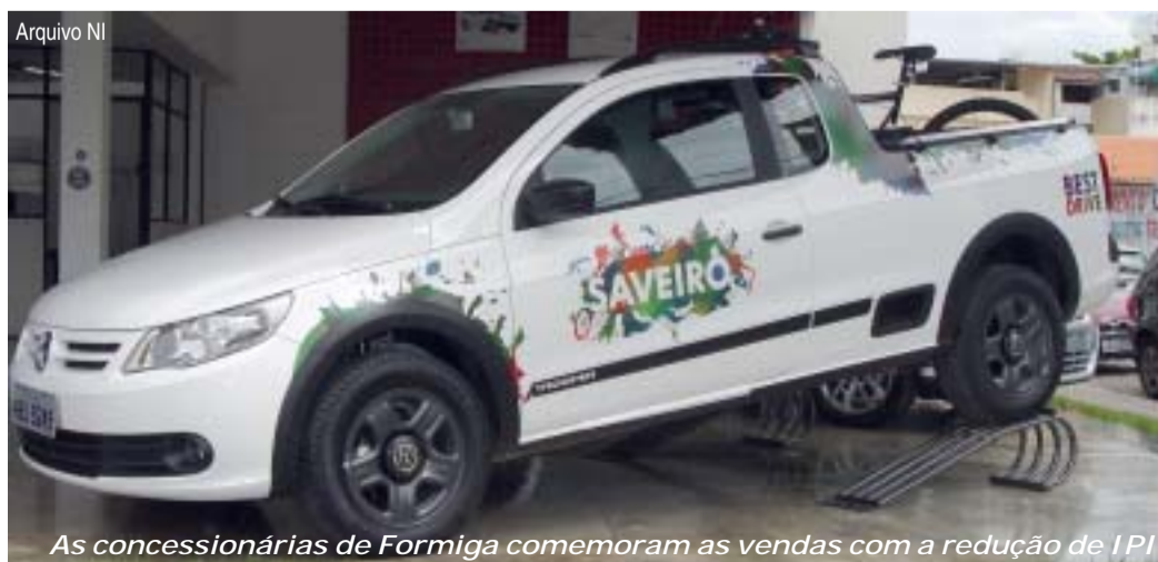
As concessionárias de Formiga comemoram as vendas com a redução de IPI

Desde então, a academia foi reaberta em maio deste ano.