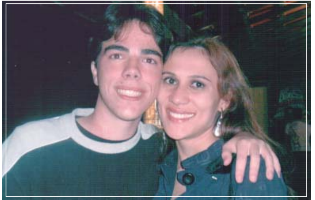
São casais bonitos como este que fazem o sucesso da coluna Ká entre Nós