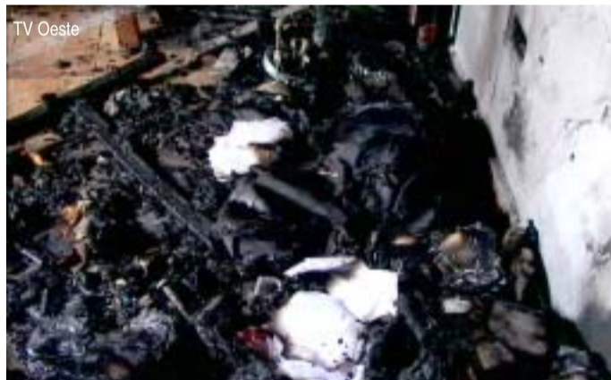
A residência na rua Nabuco de Araújo ficou totalmente destruída

ções dos vizinhos, houve um curto circuito na rua dias atrás. Eles teriam chamado a Cemig,