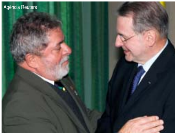
Lula cumprimenta o presidente do Comitê Olímpico Internacional, Jacques Rogge

A defesa de uma guinada geopolítica dos jogos é uma tentativa de neutralizar o efeito Obama, como ficou evidente na declaração de Nuzman após a confirmação da viagem do presidente americano. "A participação de chefes de Estado na campanha pela sede dos Jogos é uma questão de cada candidatura. A estratégia da Rio-2016 para a apresentação final já está defi-