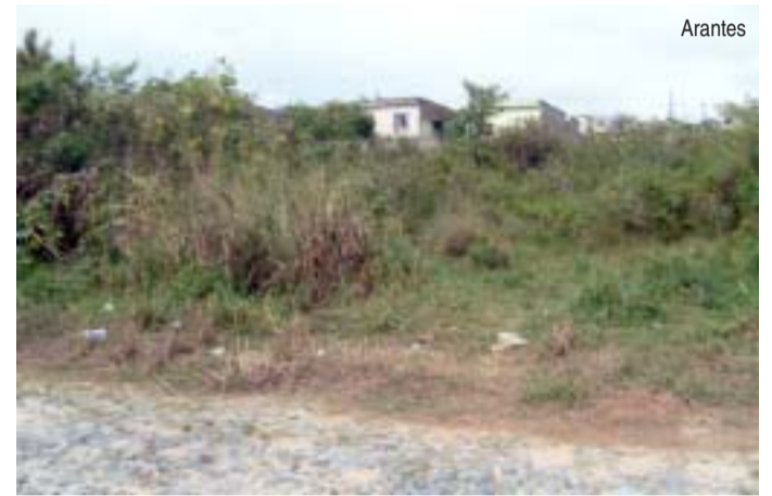
Lotes como o da rua José Pedro da Silva, no Bela Vista não poderão ficar mais abandonados